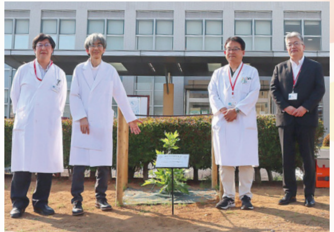
101年目も「地域に愛され、信頼される病院」を目指して。

今は小さな記念樹ですが、大地に深く根を張り、やがて高く伸び大樹になります。このヒポクラテスの樹に負けないよう、当院もますますの飛躍と繁栄を目指し研鑽を積むとともに、より深く地域に根ざし、皆さまに上質な医療を提供できるよう邁進してまいります。