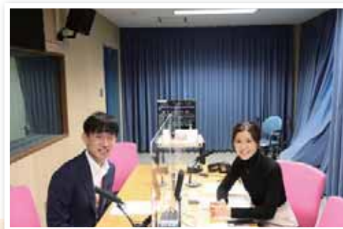
パーソナリティは菊地真衣アナウンサー！