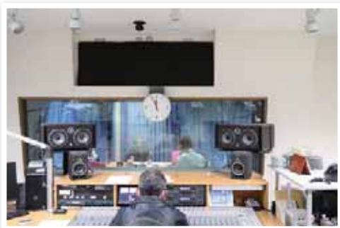
収録の様子を紹介します