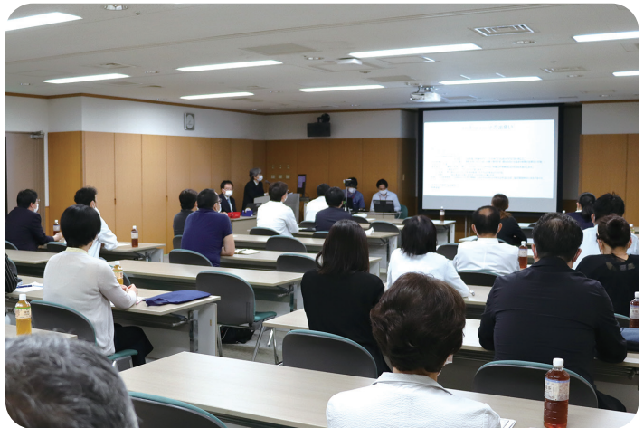
対面とオンライン配信を同時に行うハイブリッド形式で開催しました。