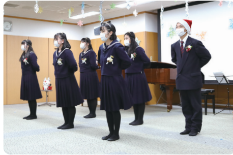
茨城県立水戸第三高等学校の生徒の皆さん