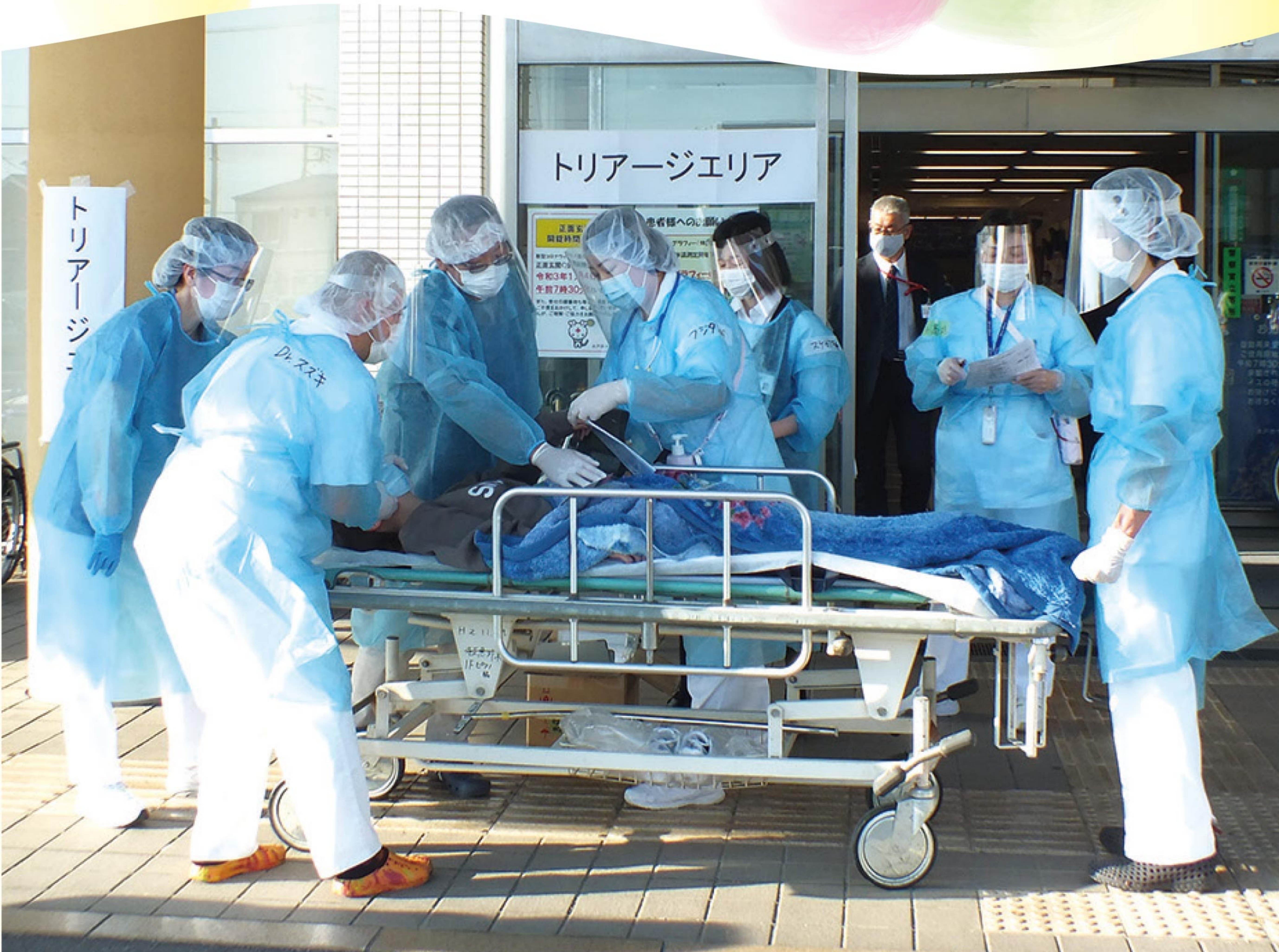
コロナ禍を想定した災害訓練の様子