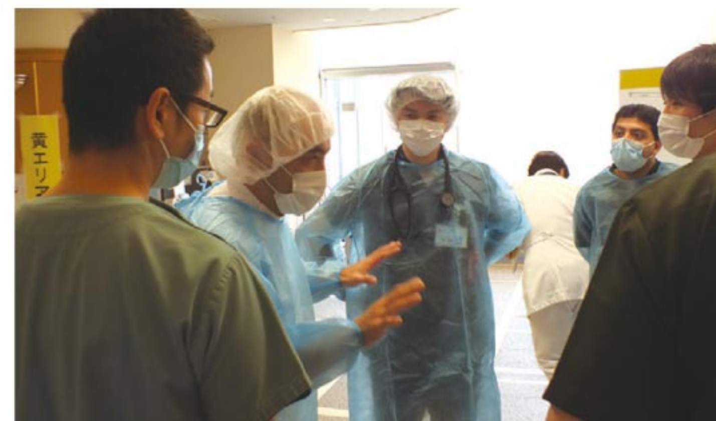
訓練開始前のミーティングの様子

新型コロナウイルスへの対応を含めた訓練は初めてでしたが、感染対応の確認も含め、課題を抽出することができ、貴重な経験となりました。