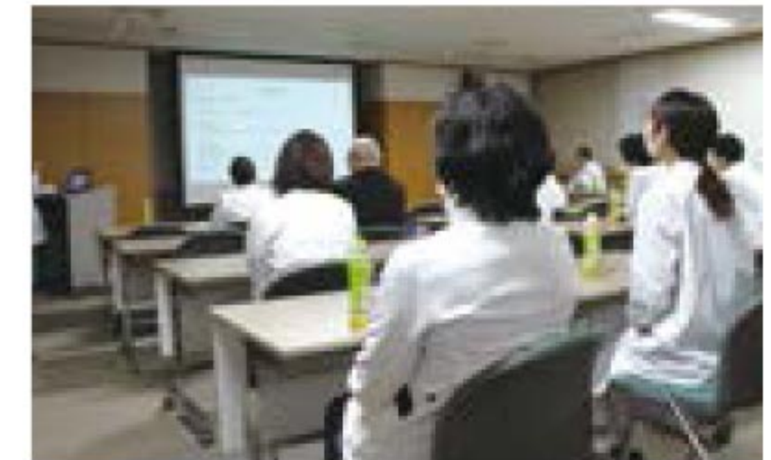
症例検討会の様子

「水戸赤十字病院 症例検討会」を開催しました。今年度2回目の開催となり、幅広い職種より31名(うち医師の出席が14名)のご参加をいただきました。