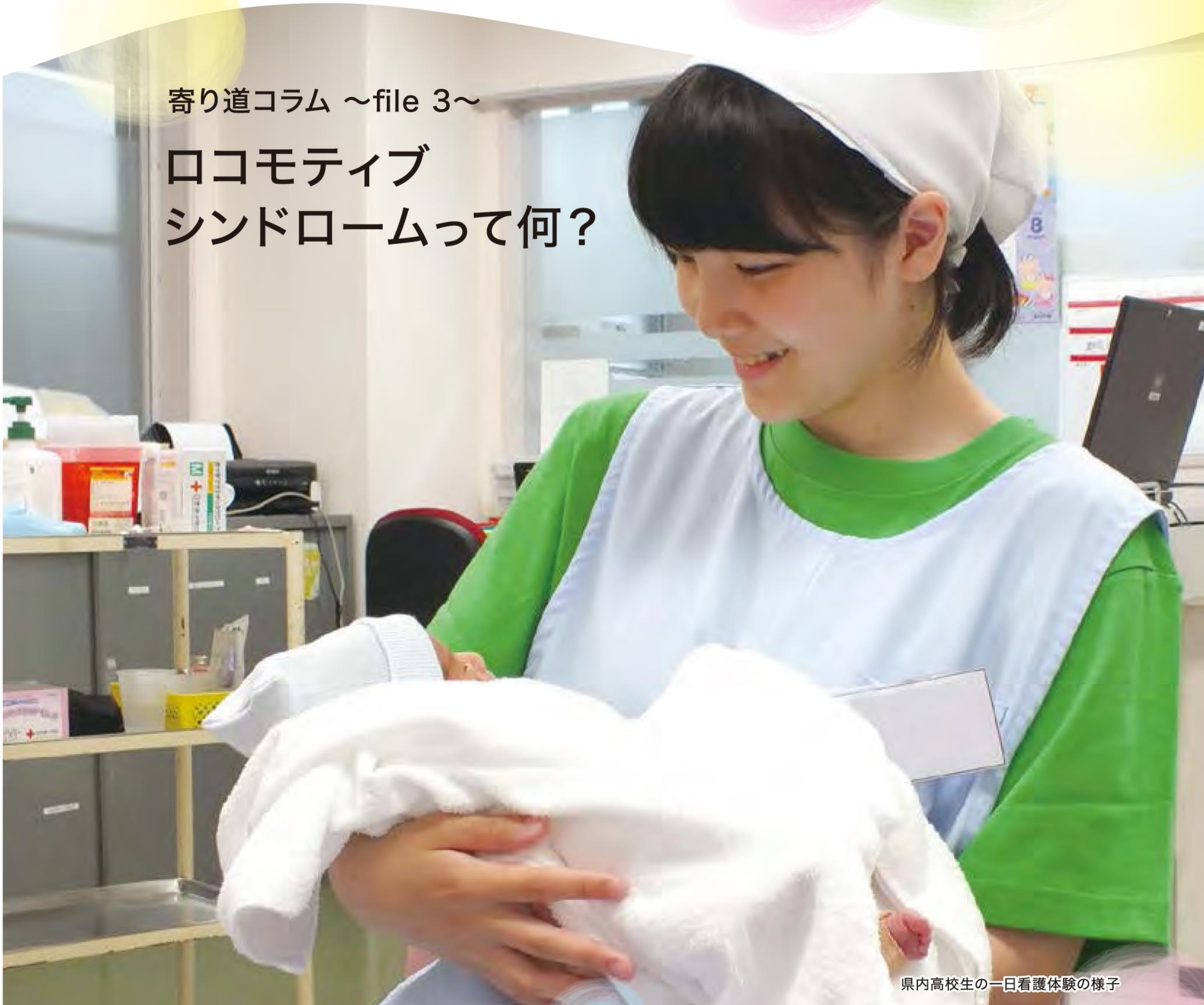
県内高校生の一日看護体験の様子