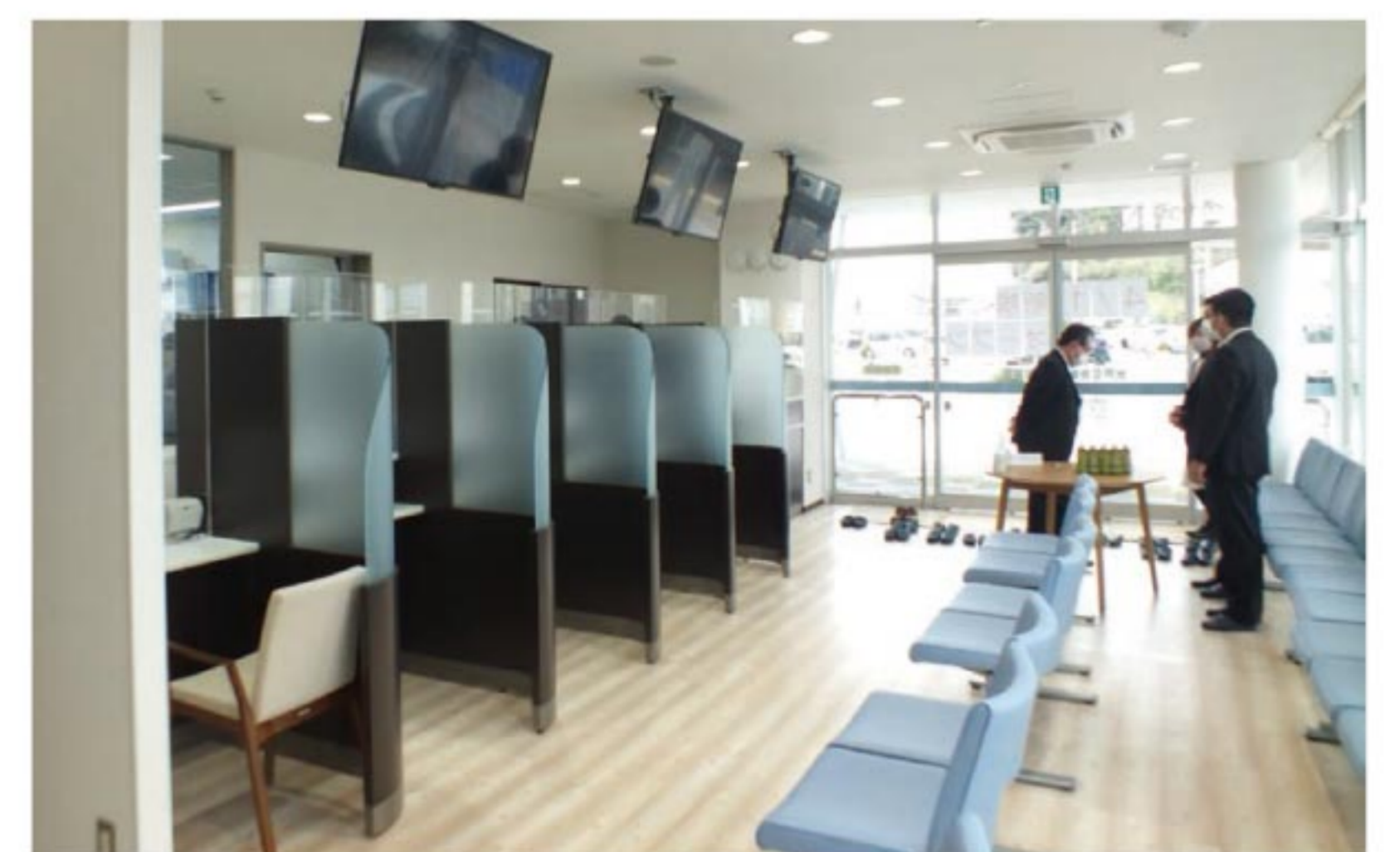
調剤薬局の中の様子

病院を利用する患者さまや地域の皆さまには長らくお待たせしてしまいましたが、当院のアメニティ施設が4月1日から営業を開始いたしました。アメニティ施設には、薬局、コンビニ、理美容室が入所しており、これからは院外処方箋のお薬を、病院の敷地内で受け取ることもできます。また、コンビニにおいても十分なスペースを確保することが出来たため、これまで以上に充実した品揃えとなっております。バス待合室もございますので、バスをお待ちいただく間にも、是非ご利用ください。