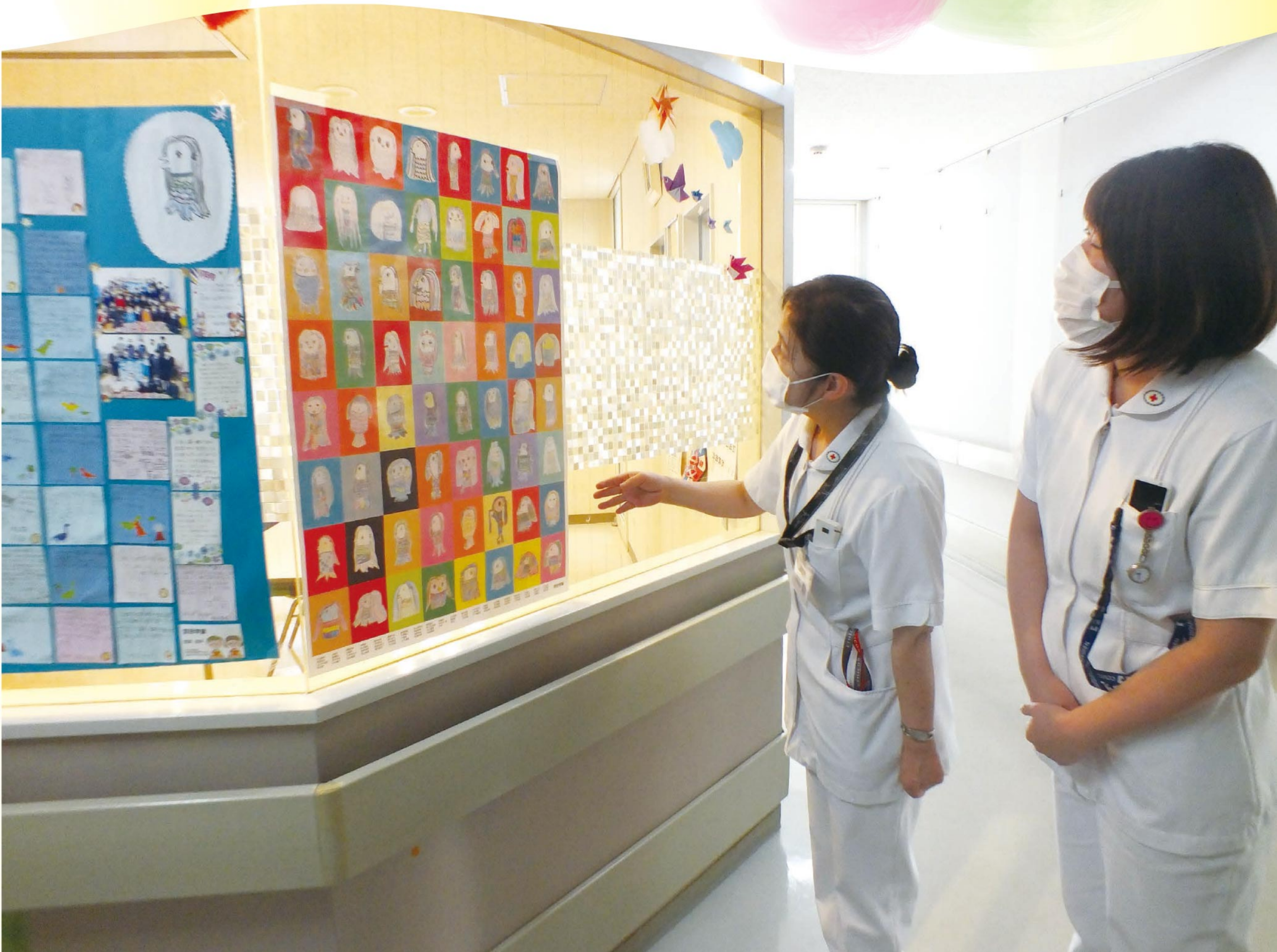
子供たちが描いたアマビエのイラストに癒されるスタッフ